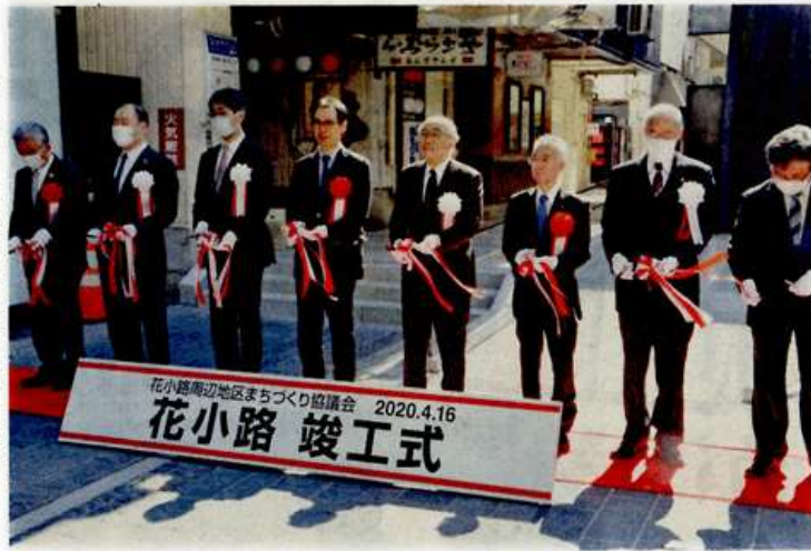
テープカットをして完成を祝う関係者 16日、八戸市中心街

成した。整備区間は約130メートル。段差の解消のほか、手すりやスロープを設置してバリアフリーに対応し、花壇も設けて景観にも配慮した。総工費は3846万円。国と市の補助金を活用し、地権者の負担は524万円となった。