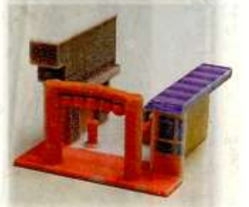
「八戸屋台村みろく横丁」