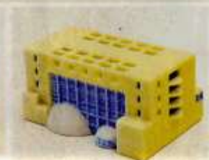
「東奥日報社八戸ビル」