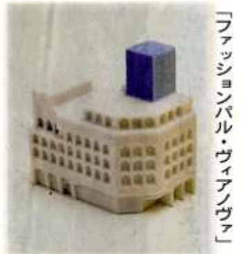
「ファッションバル・ウイアノウア」