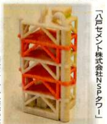
「八戸セメント株式会社NSPタワー」