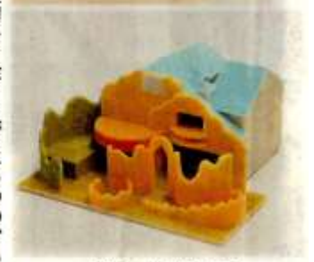
「ケーキハウスアルパジョン」